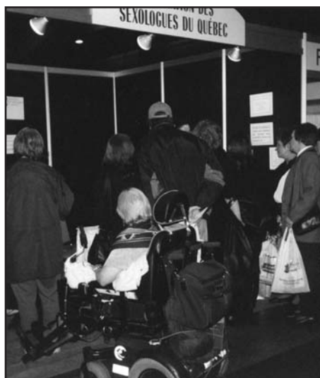
L'intérêt du public était grand.

Lors de ce salon, nous avons fait remplir un petit sondage à près de 500 visiteurs. Nous prenions ensuite le temps de leur expliquer qui sont les sexologues et ce qu'ils font. Après leur avoir expliqué les différentes formations en sexologie, force fut pour nous de constater que les gens étaient très étonnés du fait que les sexologues ont différentes formations et que seuls ceux formés en clinique sont habilités à faire de la thérapie.